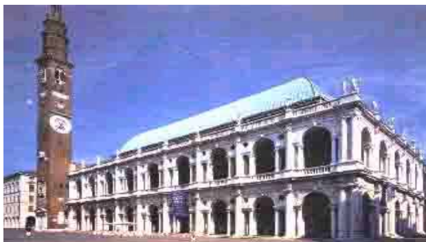
Palacio de La Razón en Vicenza -Italia -